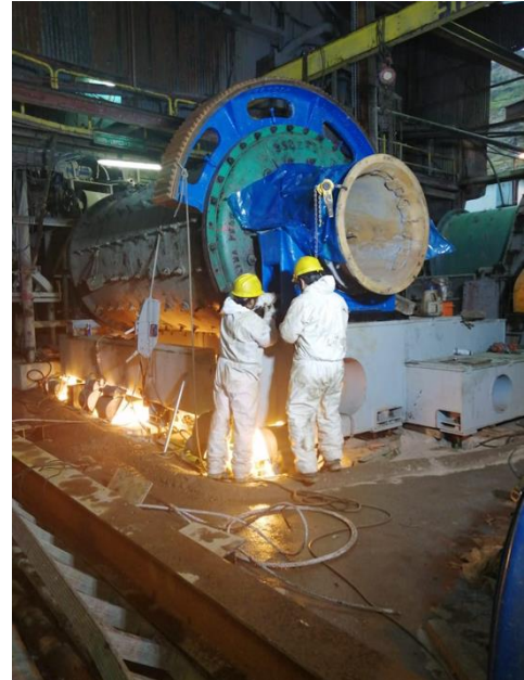
Abbildung 1: Neue Mühle in der Anlage Nueva Recuperada

Darüber hinaus wird Silver X die Implementierung eines neuen Kupfer-Flotationskreislaufs abschließen, um eine dritte Art von Konzentrat zu produzieren, das Kupfer und Edelmetalle enthält.